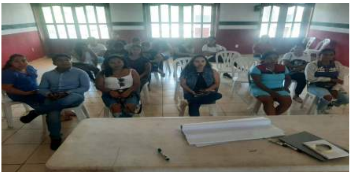
Reunión previa a la selección del Comité de Jóvenes.