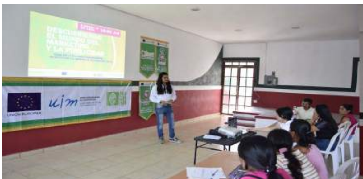
Taller de Marketing y Publicidad