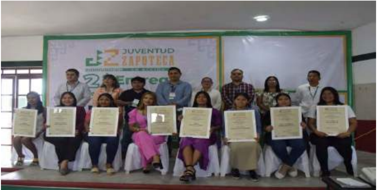
Ganadores de La Segunda Entrega de Premios al Emprendimiento

Se realizó la Segunda Entrega de Premios al Emprendimiento Juvenil el día 13 de este mes, en la cual se premiaron a ocho jóvenes de los diferentes municipios que conforman la mancomunidad, esto con la presencia del licenciado José Chira Larico, de la Unión Iberoamericana de Municipalistas.