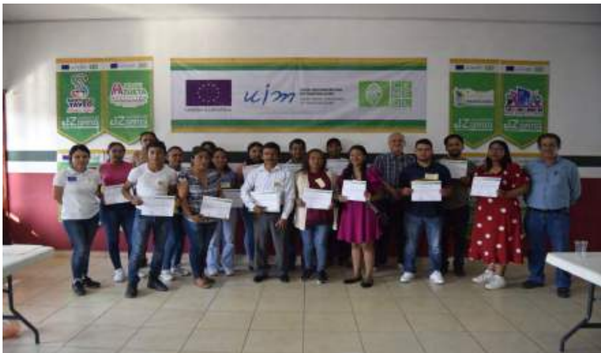
Taller para impulsar tus ideas innovadoras.