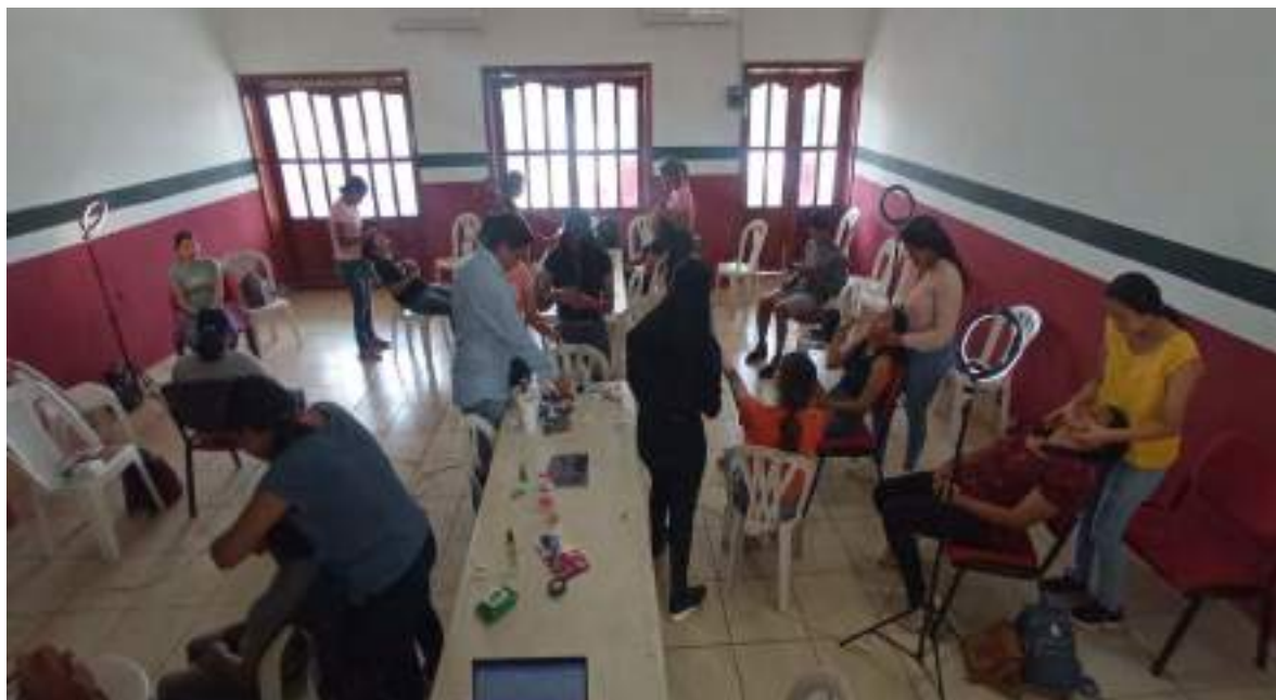
Jóvenes en taller de Maquillaje.