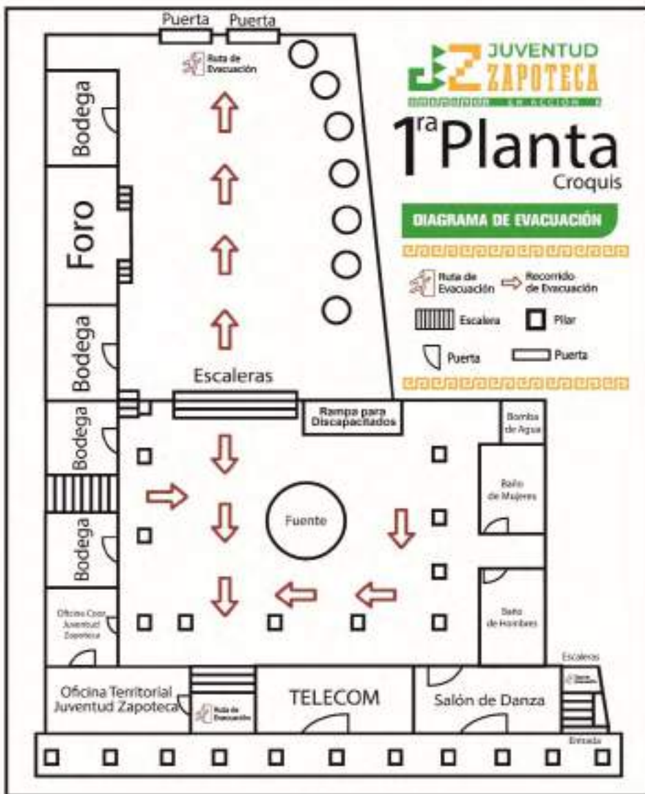
Casa de la Cultura Huaxpaltepec