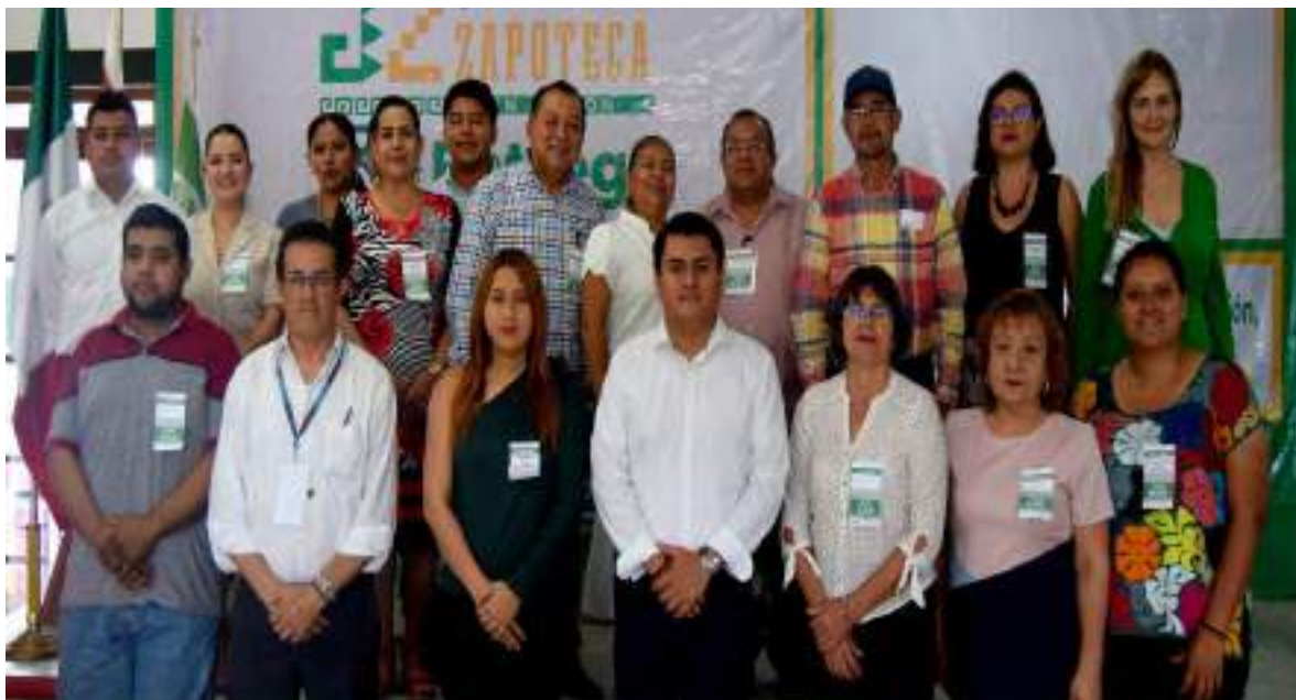
Líderes Municipales, Jóvenes y Representantes de la Unión Europea