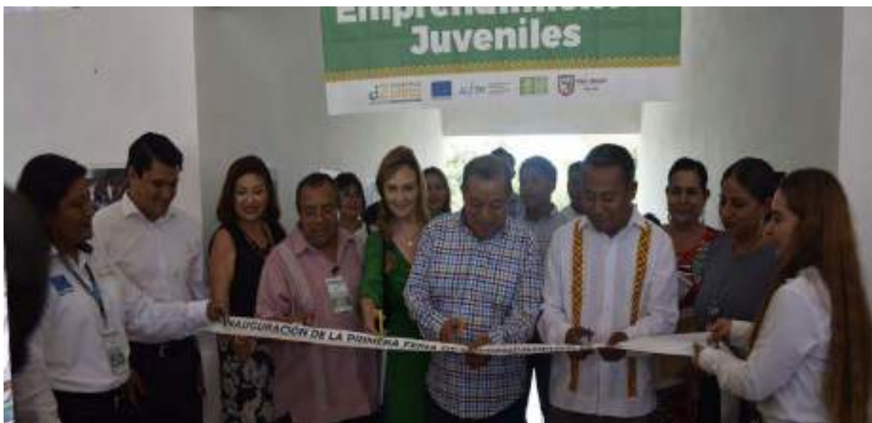
Inauguración de La Primera Feria del Emprendimiento en El Espacio Joven.

Esta feria forma parte del proyecto Juventud Zapoteca en Acción financiado por la Unión Europea, y cofinanciado por la unión Iberoamericana de Municipalistas, el Centro Mexicano para el Desarrollo Local y el H. Ayuntamiento de Playa Vicente.