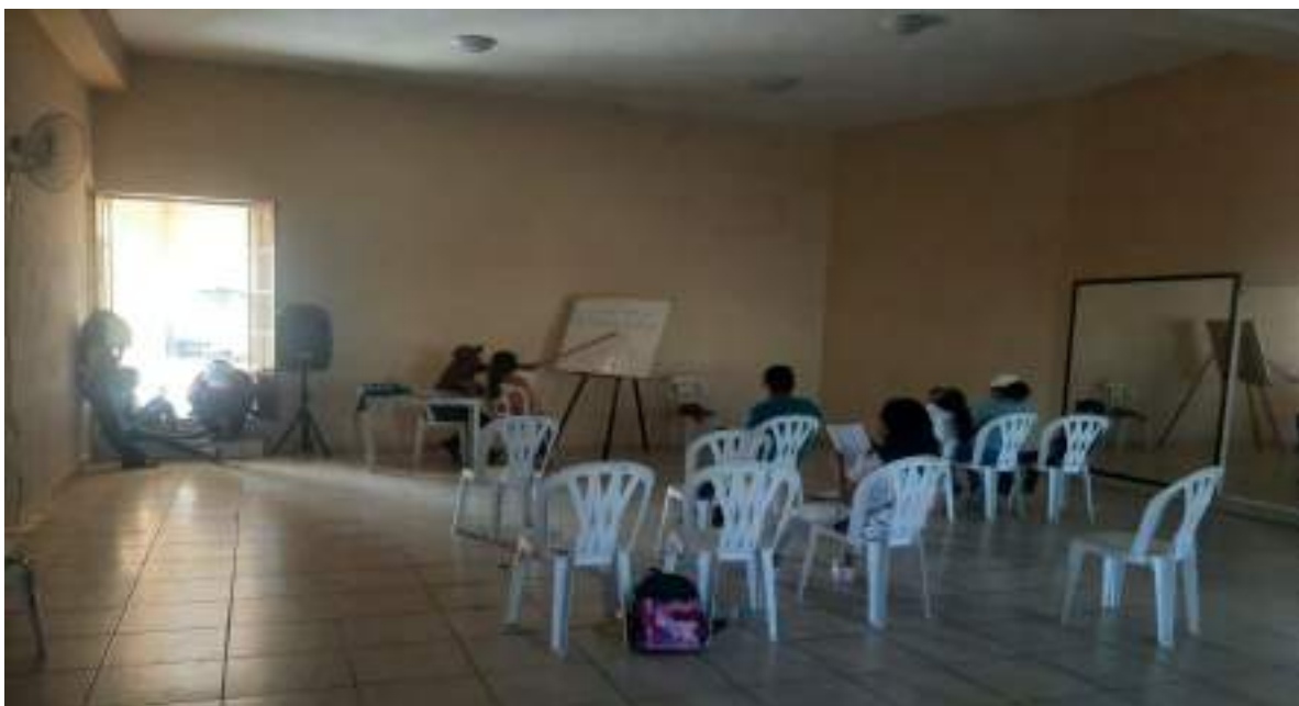
Clases Teórico de Música Filarmónica