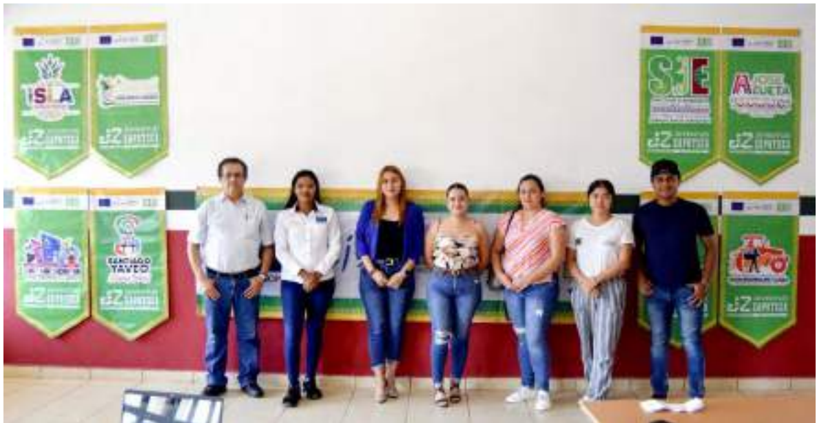
Jóvenes ADL's en el Webinar y Ponencia