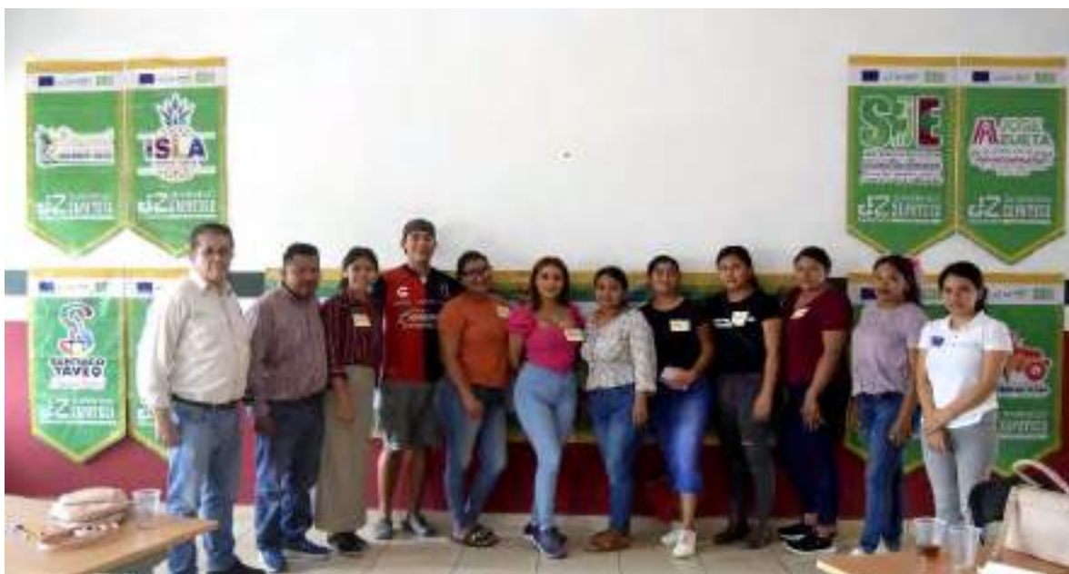
Jóvenes en el intercambio Juvenil de Emprendedores

El día 29 del mismo mes se llevó a cabo el Intercambio de Juvenil de Emprendedores, este evento reunió a jóvenes emprendedores ganadores de la primera y segunda fase del programa, quienes compartieron sus experiencias, desafíos, éxitos y lecciones aprendidas, también se realizaron ejercicios prácticos para fortalecer sus habilidades empresariales y evaluar objetivamente el progreso de sus emprendimientos.