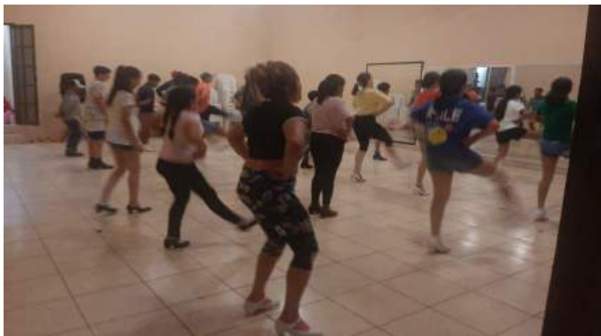
Clases de Danza