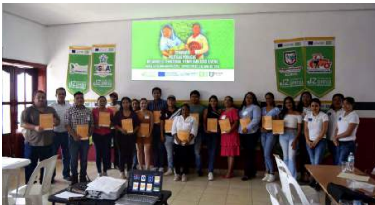
Seminario de Desarrollo Territorial y Políticas Públicas de Empleo Juvenil

Este evento fue organizado por la Mancomunidad de Municipios de la Cuenca del Papaloapan.