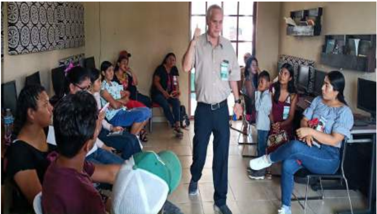
Taller de Jóvenes y Emprendimiento