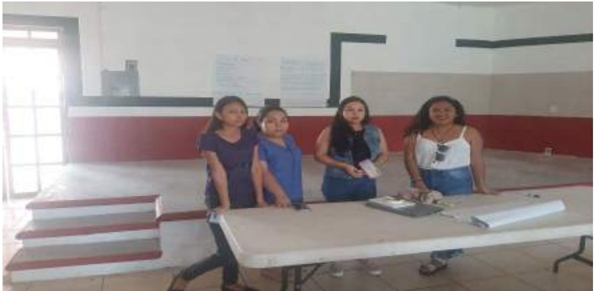
Comité de jóvenes del Espacio Joven.