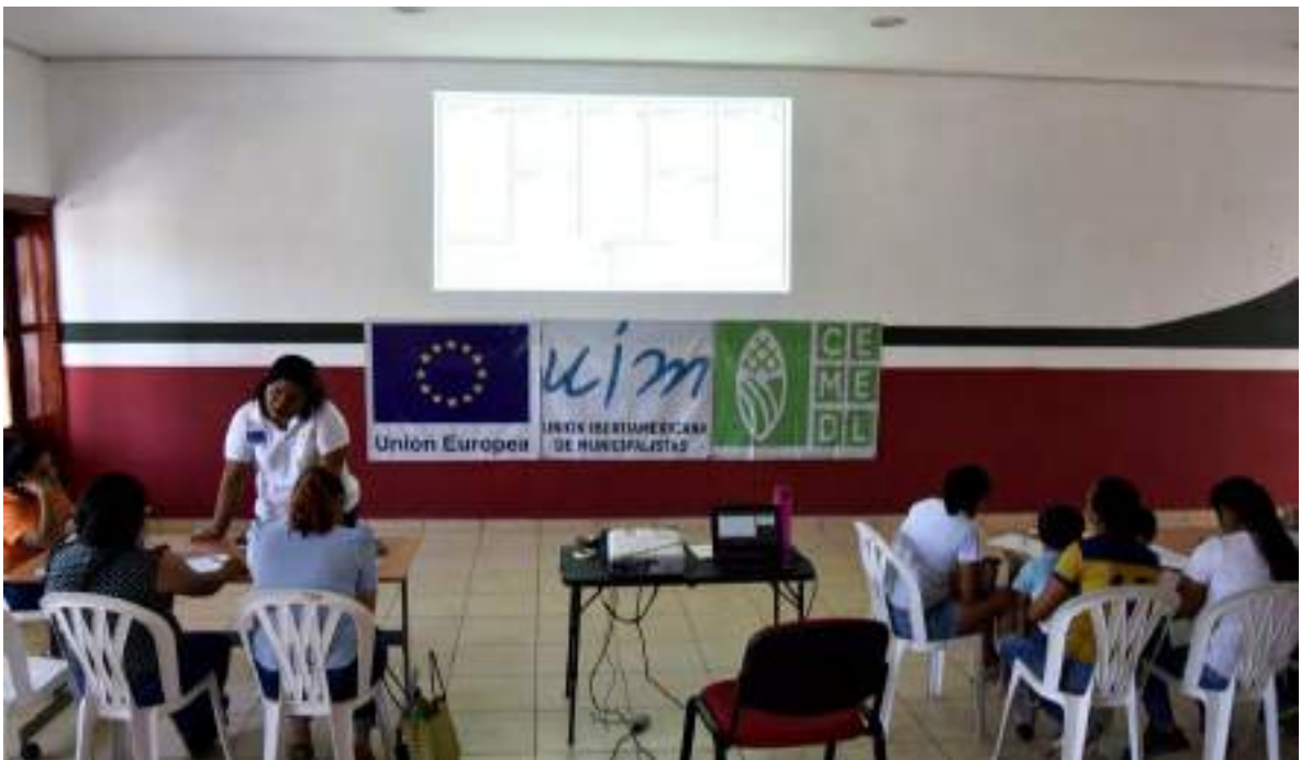
Taller para impulsar tus ideas innovadoras

El día 6 de este mes se realizó el “Taller para impulsar Ideas Innovadoras” la cual tuvo mucha aceptación en los jóvenes que se dio una segunda fecha que fue el día 16 del mismo mes, este taller fue precisamente para que los jóvenes expusieran sus ideas de emprendimiento pero que a la vez que tuvieran innovación y fuera algo nuevo en su municipio.