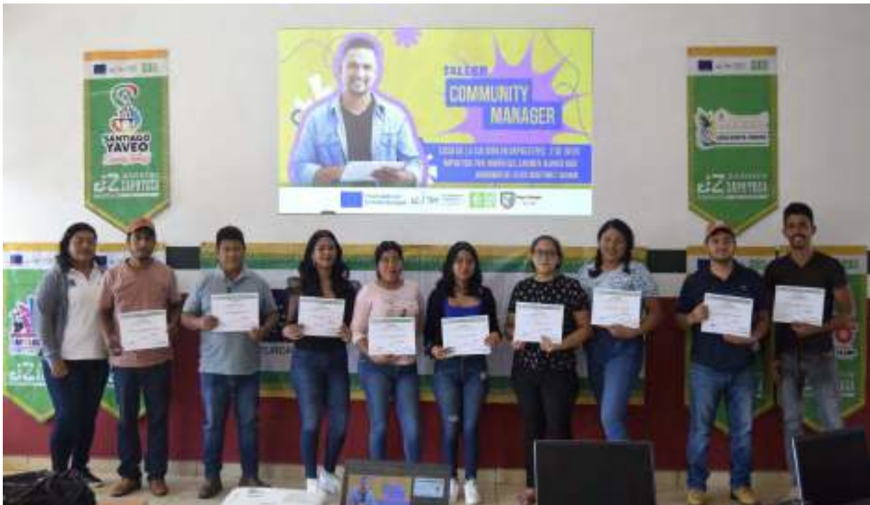
Jóvenes en el Taller de Introducción al Community Manager

Para el mes de agosto se tiene programado los Talleres que se cancelaron en el mes de Julio que son: Platica-Conferencia sobre el Bulling y el Taller de Primeros Auxilios, estos no fueron posibles realizarlos ya que los jóvenes del Municipio de Playa Vicente se encuentran de vacaciones.