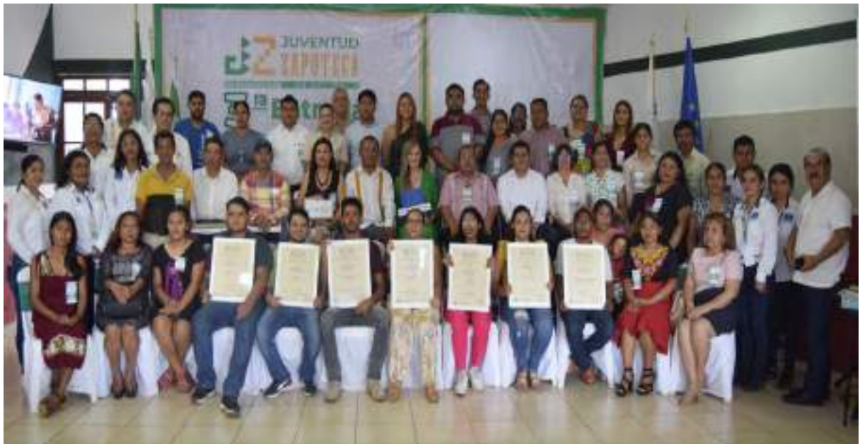
Jóvenes ganadores de la Tercera Entrega de Premios Juveniles.