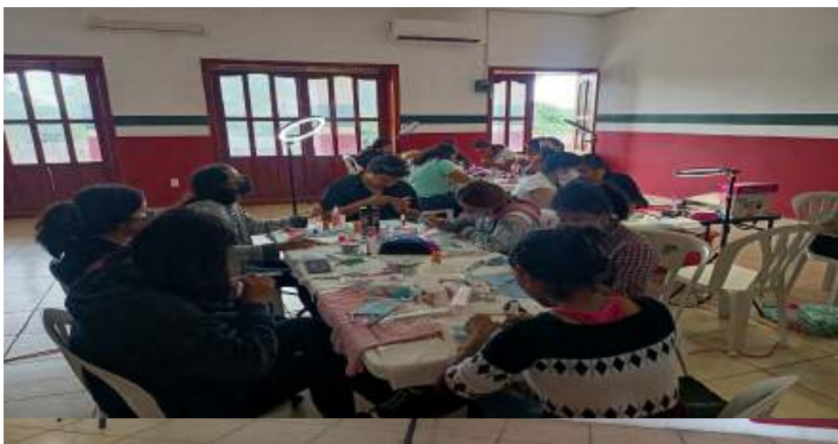
Jóvenes aplicando los conocimientos de manicura

Posteriormente se impartió el curso de Manicura Básica que estuvieron asistiendo 20 jóvenes, esto a inicios de octubre del 2023 hasta finalizar en diciembre de ese mismo año, en ese mismo lapso se realizó un taller de maquillaje con una duración de 8 horas; cerrando el año satisfactoriamente para 20 jóvenes que tomaron gustosamente la clase.